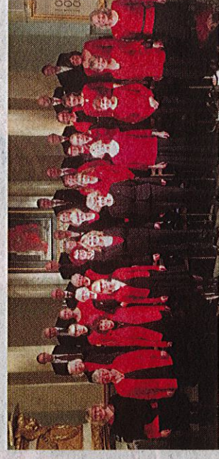
Vänersborgs kyrkas Oratoriekör ger konsert ihop med Vargöns kammarorkester på söndag.